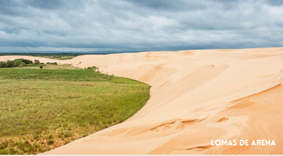
LOMAS DE ARENA