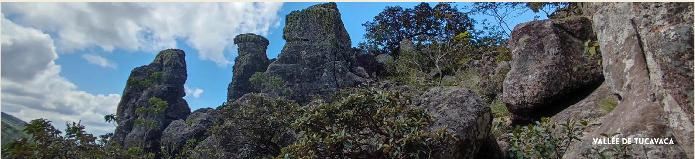
VALLÉE DE TUCAVACA

La Chiquitania est une magnifique région verdoyante située à l'extrême est de la Bolivie. Ses missions jésuites classées au patrimoine mondial de l'UNESCO témoignent d'un riche passé colonial. Ses paysages variés, entre collines et forêts tropicales, offrent une expérience naturelle unique.