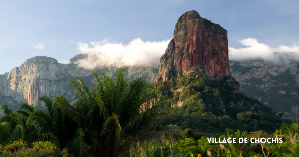
VILLAGE DE CHOCHIS