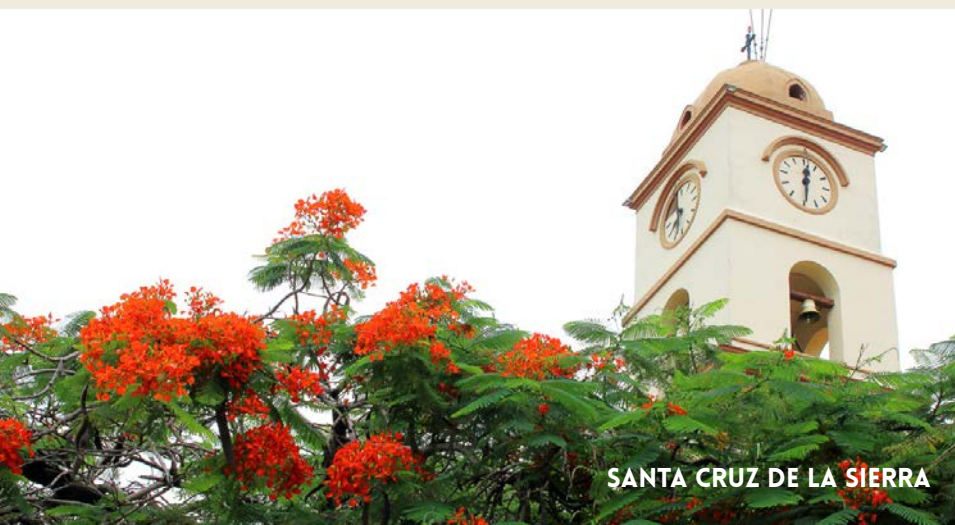
SANTA CRUZ DE LA SIERRA