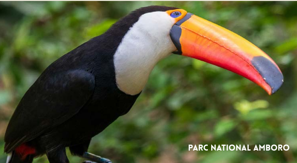
PARC NATIONAL AMBORO